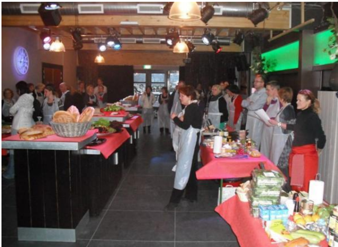
Kookworkshop medewerkers VCNS februari 2010

75 jaar geleden werd de eerste school van de VCNS opgericht in Jutphaas aan de Nedereindseweg. Deze droeg de naam School met den Bijbel. De VCNS groeide in de loop der jaren uit tot een vereniging van formaat: vier scholen (vijf locaties) in de wijken van Nieuwegein-Noord, te weten de Koningin Beatrixschool (locatie Wijkersloot en Zuilenstein), de Koningin Julianaschool, de Prinses Christinaschool en de Prinses Margrietschool. Elke school heeft haar eigen specifieke positie in de wijk. Ruim 1100 basisschoolleerlingen bezoeken dagelijks onze VCNS-scholen.