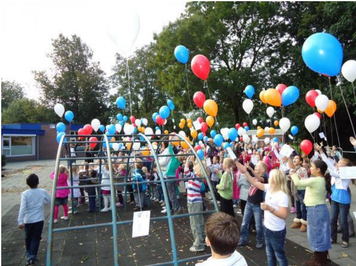
Oplaten van de ballonnen tijdens de feestweken

In 2010 zijn er binnen de VCNS geen officiële klachten ingediend bij de externe vertrouwenspersoon.