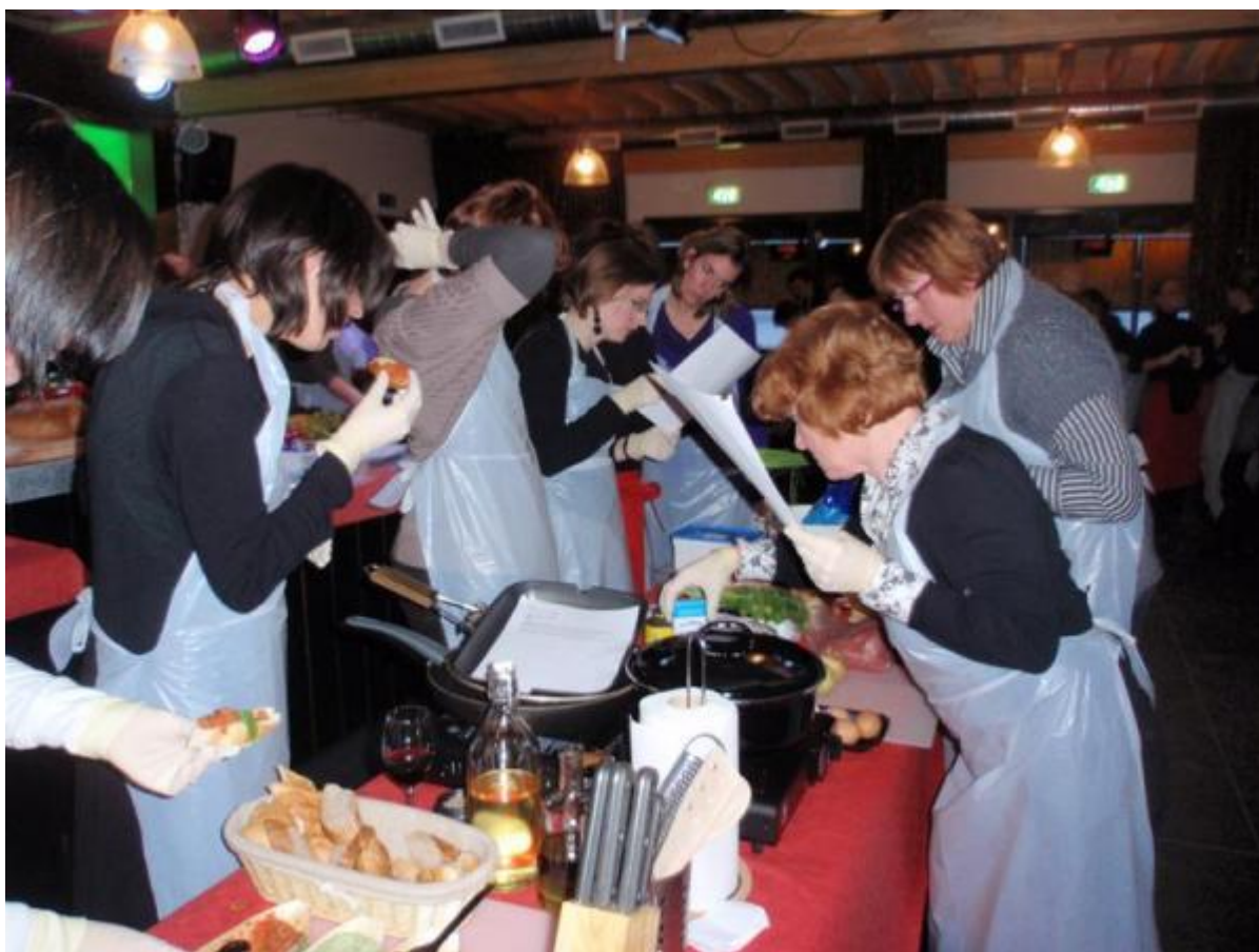
Kookworkshop medewerkers VCNS februari 2010