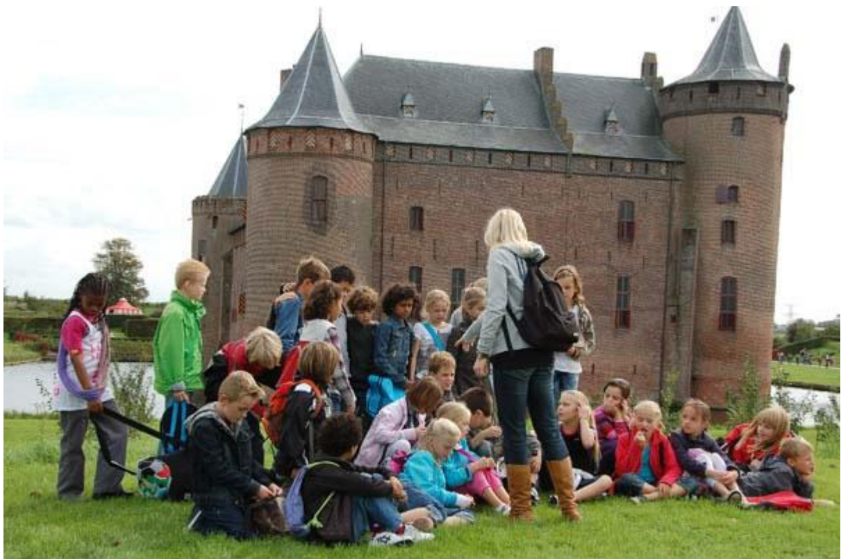
Een bezoek aan het Muiderslot i.h.k.v. 75 jaar VCNS met als thema "Koningshuis"

Opstellen en uitvoering Nascholingsplan Invoering Functiemix Taakbeleid Gesprekscyclus; voortgangsgesprekken en POP Deelname opleiden in school